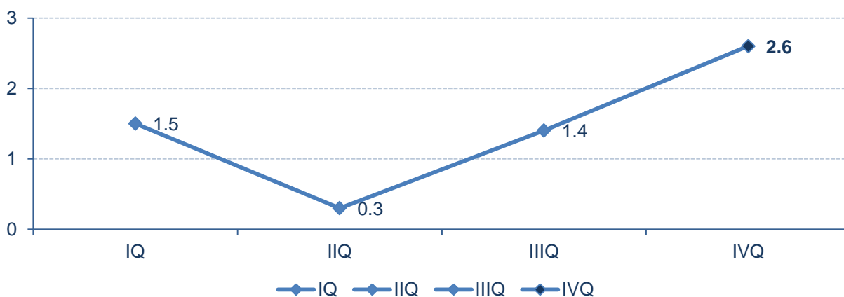
Grafik 1: Pregled realnih stopa rasta za period IQ2014 - IVQ2014