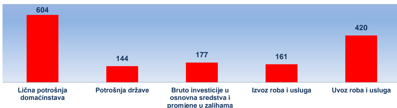
Grafik 1. Kategorije potrošnje BDP-a u tekućim cijenama (u mil. EUR)