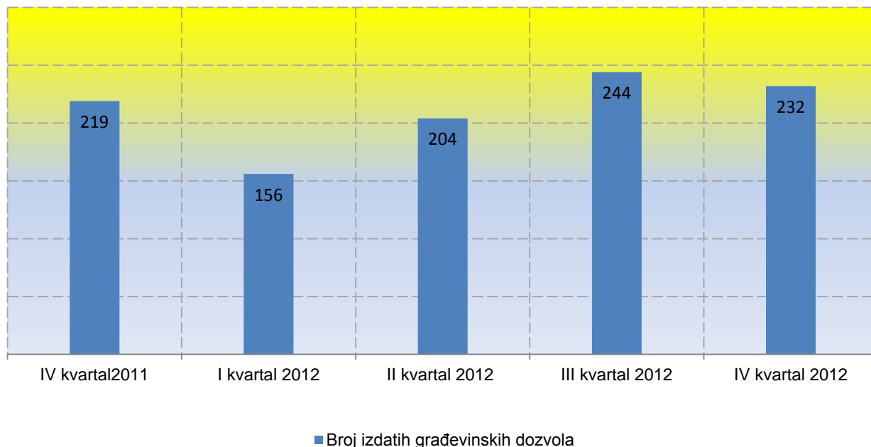
Grafik 1. Broj izdatih građevinskih dozvola

Ukupan broj stanova za koje su izdate građevinske dozvole u IV kvartalu 2012. godine je veći za 16,3%, u odnosu na isti kvartal prethodne godine, dok je za 37,5% veći u odnosu na III kvartal tekuće godine.