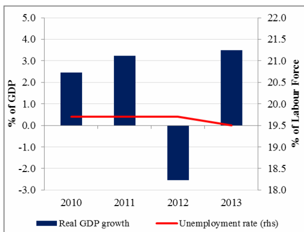
Slika 1: Rast BDP-a i nezaposlenost

Spoljne neravnoteže popuštaju. Deficit tekućeg računa smanjen je u 2013. godini na 14,6% BDP-a sa 18,7% prethodne godine, više usljed smanjenja uvoza, nego zbog poboljšanja izvoza. Pa ipak, trgovinski deficit ostaje jedan od glavnih strukturnih problema, koji odražava usku proizvodnu bazu lokalne ekonomije, nedostatak konkurentnosti i visoku zavisnost od uvoza. U 2013. godini dobri izvozni rezultat u oblasti električne energije proistekao je iz izuzetno povoljnih vremenskih prilika, pa je shodno tome izvoz u 2014. godini umjereniji. U prvoj polovini 2014. godine, trgovinski deficit povećao se za 4,5% u odnosu na prethodnu godinu jer je izvoz znatno brže umanjen u poređenju sa uvozom, pa se bazični učinak prethodnog izvoza električne energije izgubio. Kao rezultat toga, u četiri kvartala do juna deficit tekućeg računa blago je porastao do 14,8% BDP-a. Do sada, rizici su ublaženi u pogledu finansiranja. U 2013. godini, ukupni neto priliv kapitala bio je veći od deficita tekućeg računa, što je uzrokovano neto prilivom stranih direktnih investicija u iznosu 9,7% BDP-a i transferima. Ovo je omogućilo centralnoj banci da poveća svoje