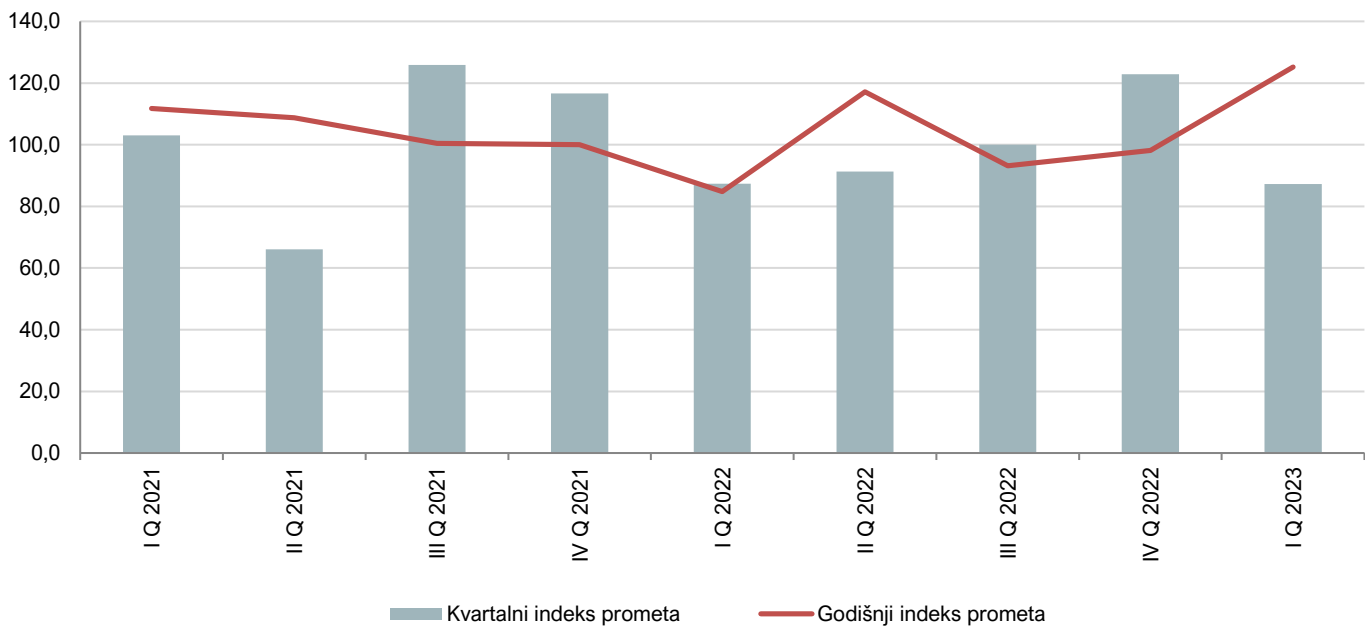
Grafik 2. Kvartalni i godišnji indeksi prometa u industriji

Indeks prometa u industriji u Crnoj Gori u I kvartalu 2023. godine bilježi rast u odnosu na I kvartal 2022. godine za 25,2%, dok je u odnosu na IV kvartal 2022. godine zabilježen pad od 12,8%.