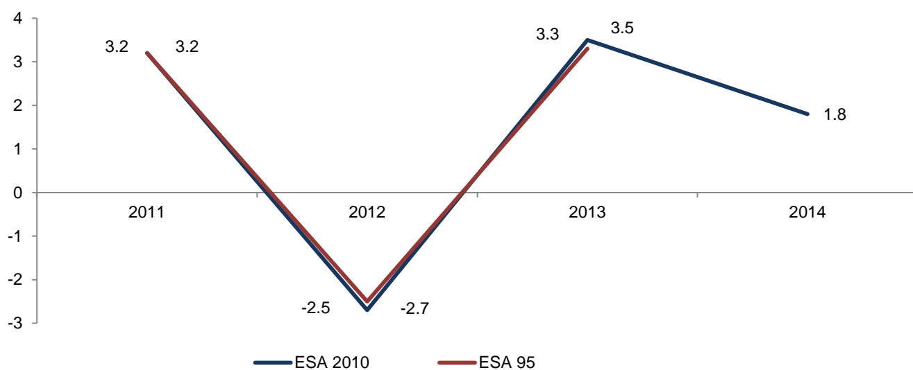
Tabela 1. Bruto domaći proizvod