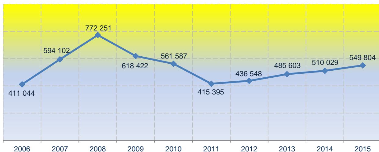
Investicije u osnovna sredstva - tekuće cijene (u hilj. EUR), Crna Gora

Ostvarene investicije u osnovna sredstva u Crnoj Gori u 2015. godini iznosile su 549,8 mil. EUR, dok su u 2014. godini iznosile 510,0 mil. EUR.